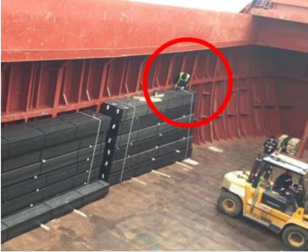
Resim 9: Yükleri Kendi İçerisinde Bağlamakla Meşgul Lashing Personeli

Sapancı (kazazede) sancak taraf 6 ncı sıra istifin üzerine yükleme yapmaya çalışan forklifte çok yakın bir konumda iken üzerine devrilen yükler nedeniyle forklift ile yükler arasında kalmıştır. Diğer taraftan geminin sancak tarafında yükleme işlemi devam ederken, iskele taraftaki profil boru istifinin üzerinde bulunan lashing personeli yükleri kendi içerisinde bağlamaya çalışmakta, bir diğer sapancı personeli ise ne kendi bünyesinde ne de gemi bünyesine bağlı bulunmayan istifin üzerinde bulunmaktadır(Resim 8, Resim 9).