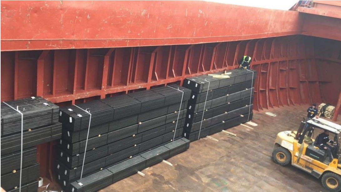
Resim 10: Lashing Devam Eden Yükler

Diğer taraftan ALİ OSMAN E gemisinde yükleme operasyonuna başlanmış, 1 nolu ambarda iskele sancak tarafta yükler 6 bağ üst üste konulduktan sonra yük bağlama işlemlerine geçilmiştir. Kaza sonrasında kazayla ilgili fotoğraflar incelendiğinde; devrilen istifteki ve diğer yüklerin birbirlerine bağlandığı fakat, gemiye bağlı olmadıkları tespit edilmiştir (Resim 10). Bu nedenle yükler geminin sancak veya iskelesine meyil etmesi sonucu oluşabilecek devrilme riski ile karşı karşıya kalmıştır. Bu durumun kazaya etki eden emniyet faktörlerinden biri olduğu değerlendirilmektedir.