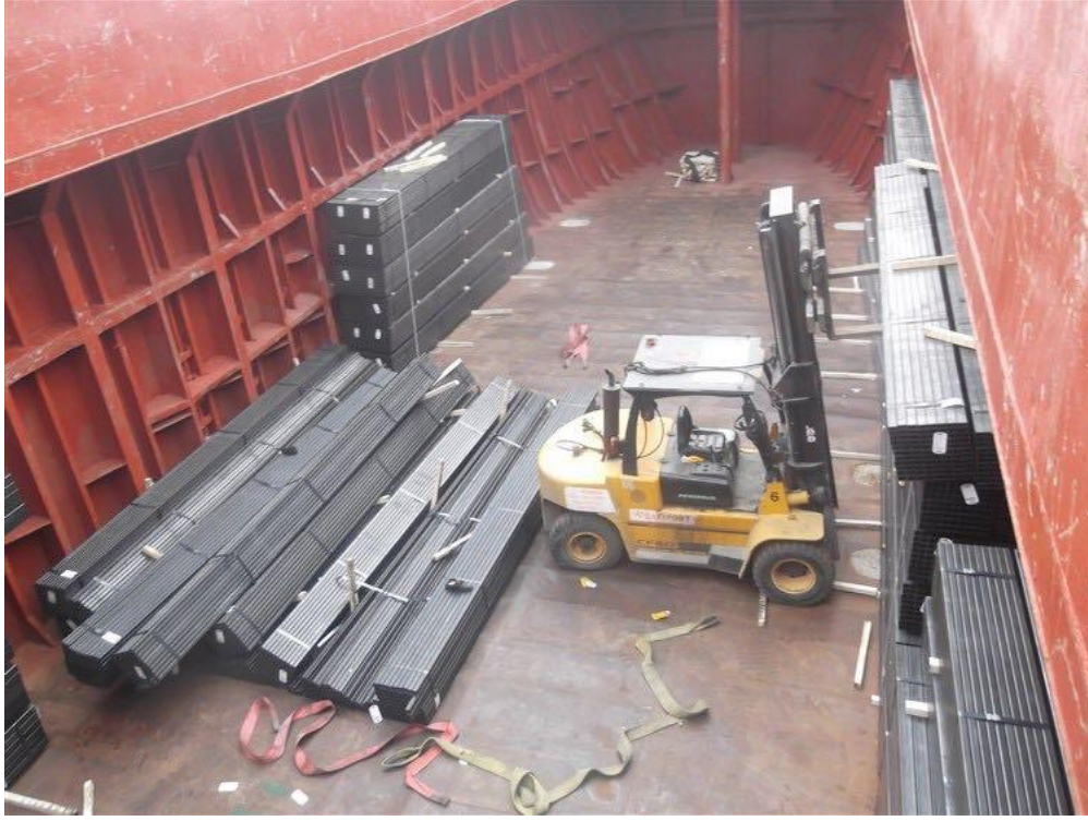
Resim 4: Kaza Sonrası