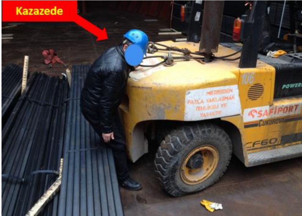
Resim 5: Profil Borular İle Forklift Arasına Sıkışan Kazazede 1