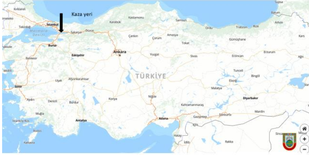
Resim 1: Kazanın Yeri

Not: Rapor da kullanılan tüm saatler yerel saattir (GMT +3)