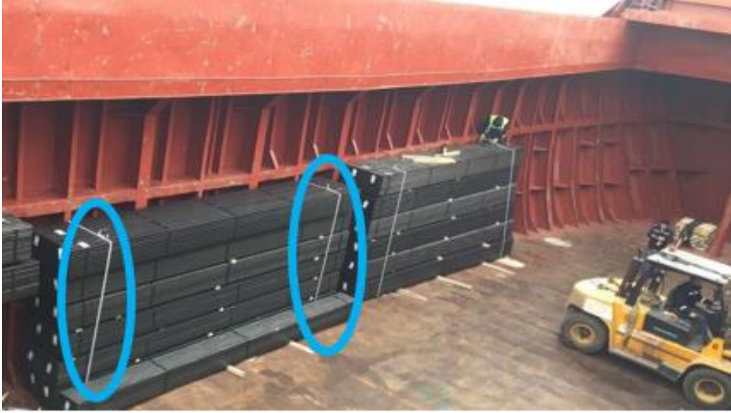
Resim 6: Devrilen istif

Forklift ile 4 sıra 6 bağ üst üste yükseklik olacak şekilde geminin sancak ve iskelesine yükleme yapıldıktan sonra yük bağlama işlemine geçilmektedir. Kaza anından hemen önce yüklemeye dair fotoğraflar incelendiğinde (Resim 6) iskele taraftaki yüklerin birbirine bağlandığı görülmektedir.