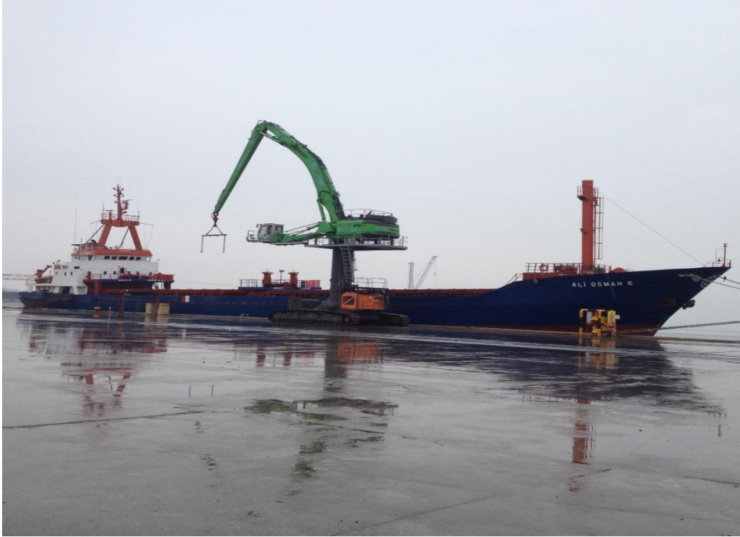
Resim 2: Ali Osman-E isimli Gemi