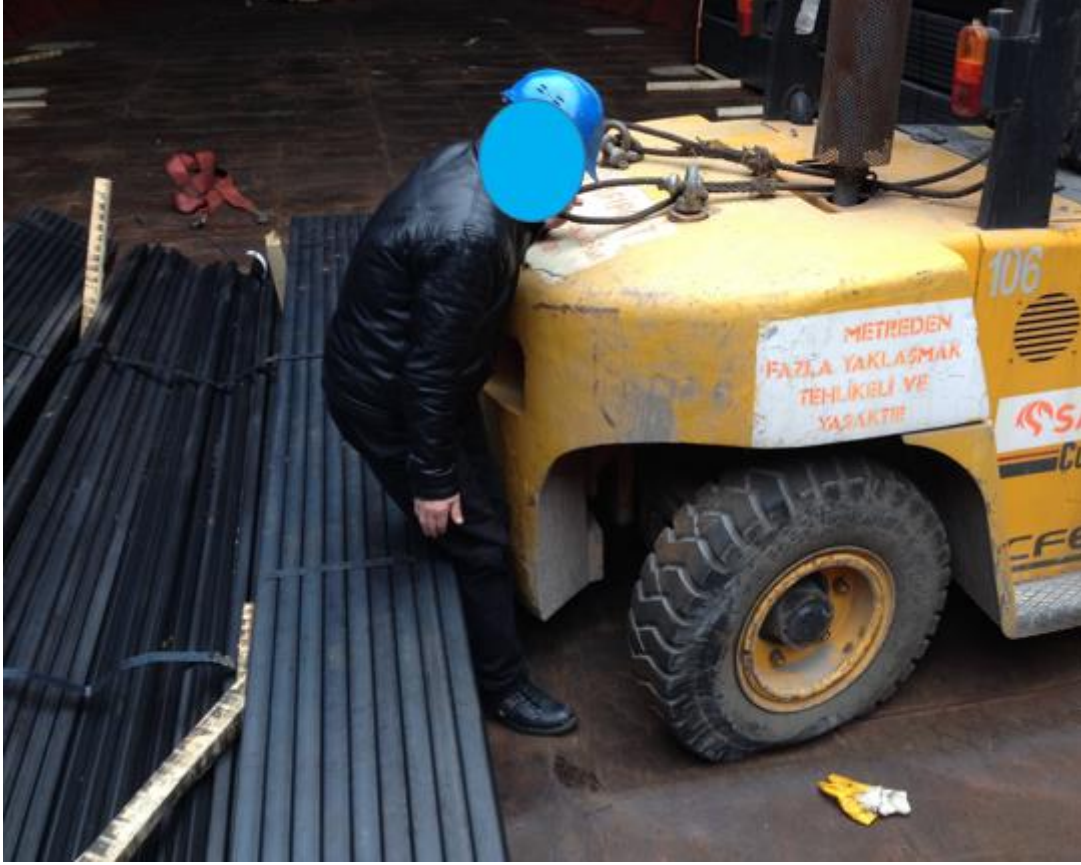
Resim 7: Devrilen İstif ile Forklift Arasında Kalan Kazazede (Temsil)

Yükleme operasyonunda yer alan liman personeli, yükün bağlanmasında görevli personel, gemi personeli ve forklift operatörü forkliftin gemi üzerinde hareketinden dolayı geminin dengesinin bozulacağını dolayısıyla yükün devrilebileceğini öngörememişlerdir.