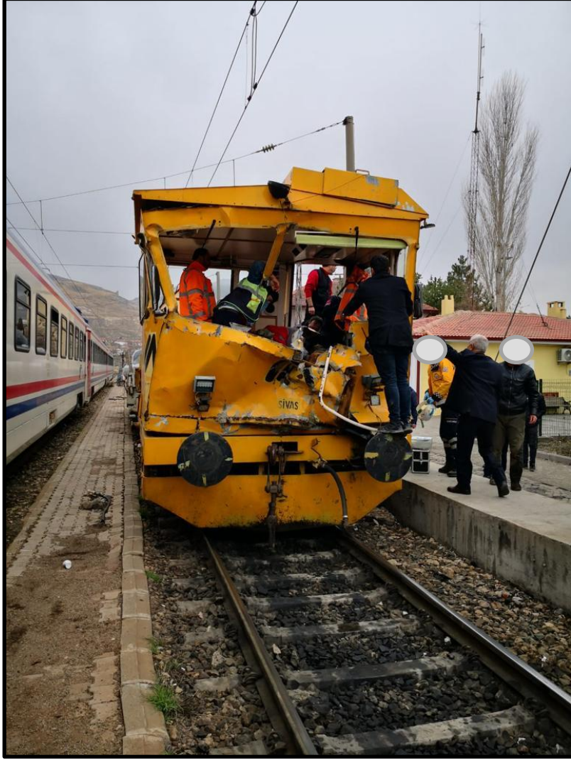
Resim 1 (Kazadan Sonra Yaralıları Divriği'ye Getiren Hasarlı Poz Otosu)

9 Aralık 2019 tarihinde Divriği-Kemaliyeçaltı İstasyonları arası yol çalışmaları için alınan bölge zaman izni sonrasında 49350 sefer numaralı poz otosu önüne bir yük vagonu bağlı bir şekilde Divriği'den saat 10:25'te hareket etmiş, MDA hemzemin geçitten raylara konularak poz otosunun peşinden bağısız vaziyette takip etmiştir. Poz otosunda bulunan toplam 14 kişiden (ekip şefi, operatörler ve diğer işçiler) 4'ü km: 792+300'de tünel ve yarma temizliği işi için indirilmiş dönüşünde durması gereken yeri geçen MDA ile 52 nolu tünel içi km: 791+180'de saat 11:00'de kafa kafaya çarpışmıştır. Kaza sonrasında MDA demiryolu hattının dışına çıkarılmış, yaralılar hasarlı haldeki poz otosu ile Divriği'ye getirilmiştir. Poz otosunda bulunan personelden 1 işçi hayatını kaybetmiş, 5 işçi yaralanmıştır. Poz otosunda yaklaşık 20.000,00 TL maddi hasar meydana gelmiş, MDA'da kayda değer bir hasar oluşmamıştır.