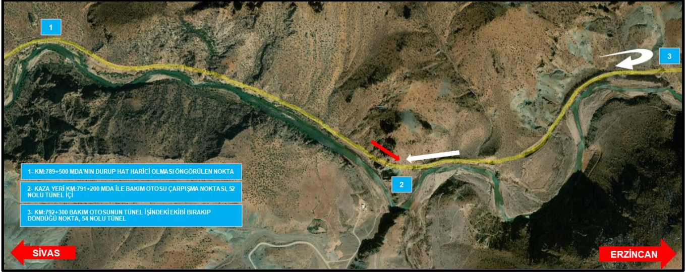
Resim 4 (Kaza Yeri Uydu Görünümü)