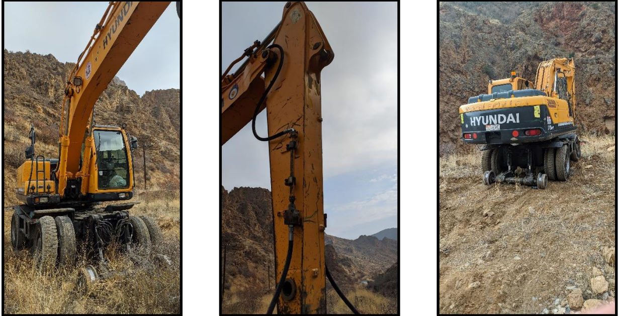
Resim 3 (Kazaya Karışan MDA)

MDA operatörüne sözlü olarak Divriği İstasyonundan hareketi öncesi km:789+500'de durması gerektiği söylendiği ifade edilmiş ancak MDA durmadan devam ederek km: 791+180'e ulaşmıştır.