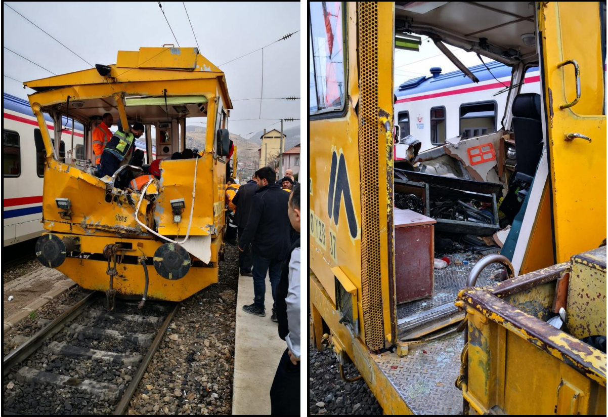
Resim 5 (Kazaya Karışan VM-170 Tipi Poz Otosu)

Kaza sonrasında MDA hat harici edilmiş, yaralılar hasarlı haldeki poz otosu ile Divriği'ye getirilmiştir. Poz otosunda bulunan personelden 1 işçi hayatını kaybetmiş, 5 işçi yaralanmıştır. Savcılık incelemesinin ardından herhangi bir hasar görmeyen demiryolu hattı trafiğe açılmıştır.