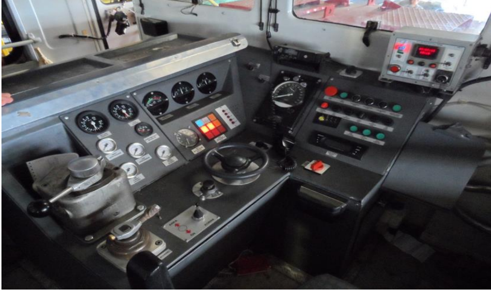
Resim 10 (24000'lik lokomotif kumanda kabini)

Makinistlerin görev, yetki ve sorumluluklarının yazıldığı TCDD'ye ait 214 numaralı genel emrin Makinistlerin Görev ve Yetkileri kenar başlıklı 10 uncu Maddesi 15 inci fıkrasında “ Birlikte görev yaptıkları yardımcı makinistlere görevleriyle ilgili konularda eğitici bilgiler vermek ve uygun şartlarda kendi sorumluluklarında onlara cer aracını kullandırmak. ” hükmü yer almaktadır.